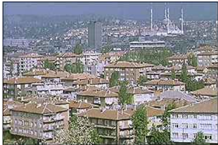
Çağdaş apartman yerleşkesi Ankara...

Ama, iyi yolda olduğumuzu, kent çevresindeki toplu konut alanlarının hızlı toplu taşıma araçlarıyla yakında kente bağlanacağını söyleyerek, "dolmuşlu, işportalı ve gecekondulu" kentimizi saklayabiliriz mavi gözlerimizden!