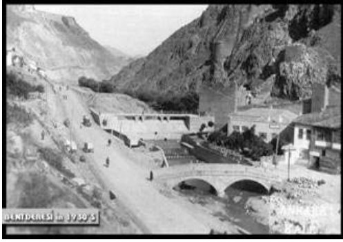
Üstü örtülen Bendderesi...