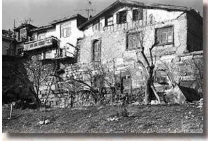
Kale içinde sur üstünde tarihsel (!) kondular...