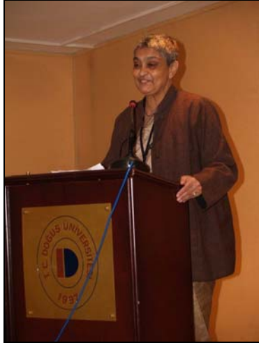
Gayatri Chakravorty Spivak açılış konuşmasını yaparken

16-18 Kasım 2005 günlerinde İstanbul’un Anadolu yakasındaki Doğuş Üniversitesi’nde, “The Endangered Planet in Literature (Edebiyatta Tehlike Altındaki Gezegen)” başlıklı bir sempozyum düzenlenmiştir. Hindistan’daki “The World Association for Studies in Literatures in English (İngiliz Dilindeki Edebiyatlar Araştırmaları Dünya Derneği)” ile Doğuş Üniversitesi’nin İngiliz Dili ve Edebiyatı bölümünün ortaklaşa düzenledikleri sempozyumun açılış konuşmasını Columbia Üniversitesi öğretim üyelerinden Gayatri Chakravorty Spivak yapmıştır.